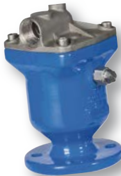
VAG DUOJET 264 Automaattinen ilmanpoistoven- tiili vedelle PN 10/16/25 DN 50...200 Yksikammiorakenne 3 toiminen