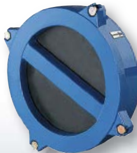
VAG ZETKA Läppä yksisuuntaventtiili Vesi, teollisuus PN 10/16 DN 40...400 Laippojen väliin asennettava