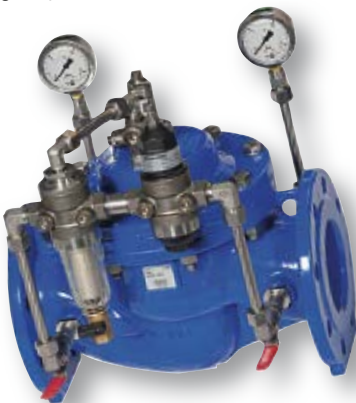
Omavoimainen säätöventtiili DN 50-300 PN 10/16 Paineenlennus ja -pito Virtauksen säätö ja rajoitus Varoventtiili Yksisuuntaventtiili Paineiskun hallinta Uimuriventtiili ym.