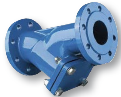
VAG mudanerotin vedelle DN 40...400 PN 10/16 Runko valurautaa GG-25, RST sihti Epoksipulveripinnoite