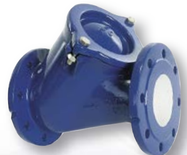
VAG RKV Pallo yksisuuntaventtiili Jätevesi, teollisuus PN 10 DN 40...350