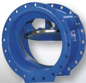
VAG SKR Vaimennettu läppätakaisku- venttiili DN 200-1200 DN 10/16