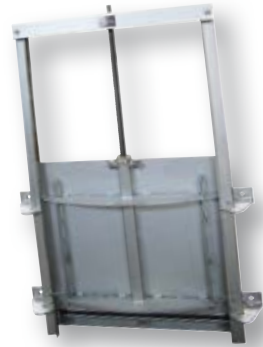
VAG patoluukut Jätevesi, vesi DN 150...4000 Tiivis 6m asti Seinämään asennettava Täyttää juomavesi standardit Ruostumatonta terästä