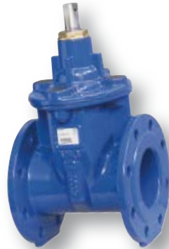
VAG EKO plus kumi-luistiventtiili laipoin Vesi ja jätevesi PN 10/16 DN 40...600 Epoksipulveripinnoite